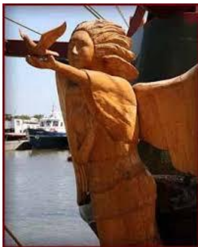
Boegbeeld van verandering

Het is aan de gemeenteraad om te bepalen hoeveel haast men met de verandering wil maken. Wil men tot maart 2020 wachten of zou een waarnemer als boegbeeld van verandering al eerder aan de slag moeten?