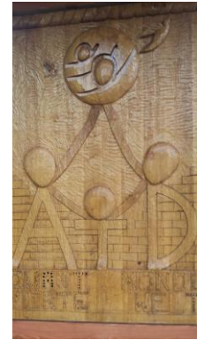
Aide à Toute Détresse (ATD)

projecten die bijdroegen aan de culturele en maatschappelijke verheffing van de 'uitgeslotenen'.